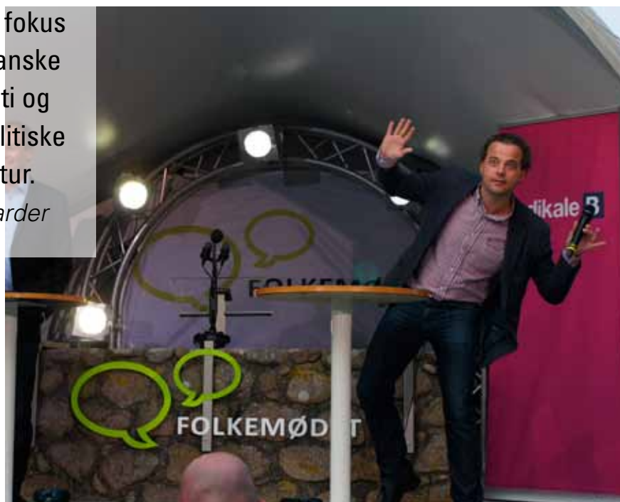
Folketingsmedlemmet Morten Østergaard på slap line på den centrale talerstol.