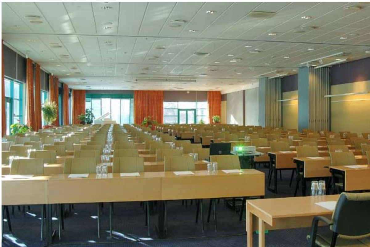
Scandic Kolding står klar til at danne rammen om NETOPs landsmøde 2008.

byggeri, der er trafik og luftforurening; hvordan kan vi reducere forureningen, og hvordan løser vi trængslen på vejene. Der er et modul om, hvordan landbruget bidrager til klimaforandringerne, og hvordan vi kan fremme et mere miljøvenligt landbrug. Der er et debatmodul, der sætter fokus på kemikalier, farlige stoffer og miljømærkning. Der er et modul, hvor I kan høre, hvordan man arbejder med bæredygtig udvikling i u-landene, og hvordan vi sikrer, at u-landene ikke kommer til at stå som tabere i kampen om et bedre klima. Og endelig er der et debatmodul, hvor I kan høre om projekt Friland – et bo- og boligeksperiment baseret på bæredygtighed og økologi på Djursland. De fleste af jer kender det sikkert fra DR's udsendelser.