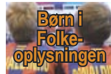
Uden mad og drikke ... Jobbet som dirigent kræver sit.