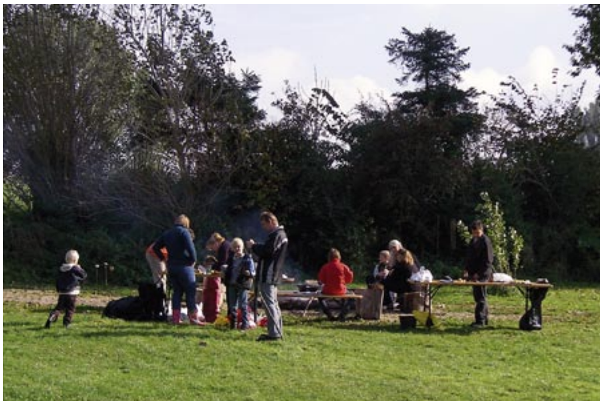
Friluftsliv i Hammer Bakke hvor Jægerspris Husflid er vært.

en uge i sommerferien med at arbejde med en masse spændende fag. Både Kerteminde Husflid og Verninge Husflid har igennem mange års succesrige sommeruger fået bygget gode traditioner op. Det betyder da også, at begge foreninger så småt skal til at sætte adgangsbegrænsninger op, da deres huse knap kan rumme flere. Læs i øvrigt artiklen om Bodil og Flemmings tradition med at invitere børnebørnene med til Kerteminde hver sommer.