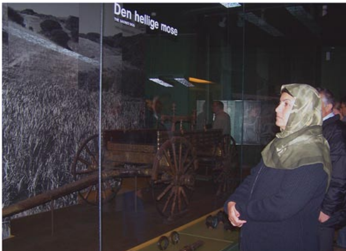
Kurset i samfundskendskab kommer vidt omkring. Her er kursisterne på besøg på Nationalmuseet.

Tanken er, at skoleledere og bestyrelser i andre NETOP-afdelinger – eller i andre aftenskoler – kan benytte materialet som grundlag for tilsvarende kurser. Udarbejdelsen af materialet og afprøvningen i praksis er støttet af Dansk Folkeoplysnings Samråd, som vil lægge materialet ind på DFS’ hjemmeside, når det er færdiggjort, formodentlig i august i år. Dermed er det til fri afbenyttelse af alle aftenskoler, som har lyst til at lave kurser, der kan lette vejen mod livet som aktiv medborger i Danmark – og statsborgerskab – for lokalområdets nydanskere. Det er vores håb, at mange NETOP-aftenskoler vil gå ind med kurser for nydanskere. Måske kan vores materiale give hjælp til gennemførelsen heraf.