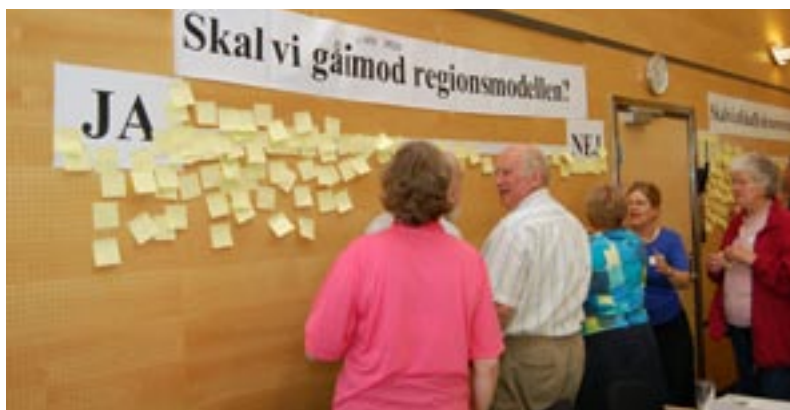
Debat, der virker. Den anderledes afstemning var en stor succes.

Og det er en vigtig pointe, da formålet med den nye debatform på landsmødet jo lige præcis var, at skabe det bedste grundlag for det videre arbejde med det tema, der nu en gang er sat til debat. Det var på alle måder et livligt landsmøde, hvor der med en bevidst planlagt debatform blev skabt nogle gode rammer for, at alle kom til orde og brugte deres medbestemmelsesret.