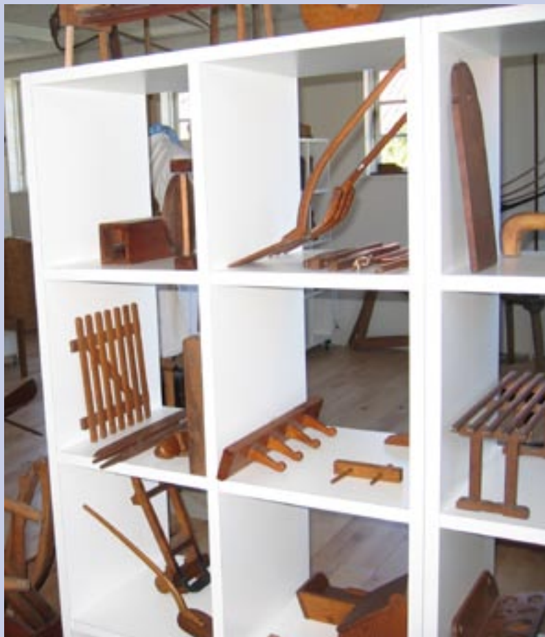
Med de nye lokaler kommer museets mange fine arbejder omsider op i lyset.

Endelig så har vi jo godt nok overstået landsmødet i NETOP, men i Dansk Husflid har vi jo endnu et, og alle forberedelser hertil skal også være klar.