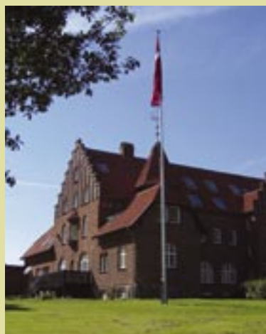
Kerteminde Højskole kan igen blive en del af Dansk Husflids virke.

Ja, noget af det kan I jo læse i ovenstående, og resten er, at hvis ovenstående aftale ikke lykkedes, så bliver museet etableret på Tyrebakken. Sara Hanghøj og Lene