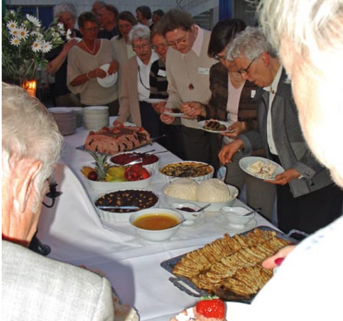
Maden på Ebeltoft Maritime Ferieby fik mange rosende ord med på vejen. Her er det dessert buffeten, der tiltrækker.

så langt. Det havde jo været en lang dag for alle. Men nej, der kom flere oplevelser. Der skulle danses folkedans. Og det kan være sjovt at være med til, når der er en dygtig leder. Det var der heldigvis her, en dygtig ung kvinde, der ledte denne workshop, ledsaget af to musikere. Så meldte trætheden sig, og dagens program havde måske været rigeligt stort.